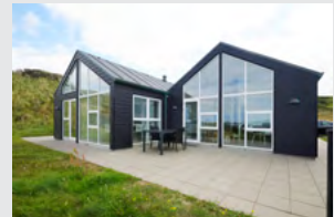
Sommerhuse med luft/ vand varmepumpe