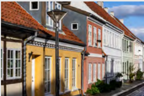
Klassiske byejendomme - også tørrelofter