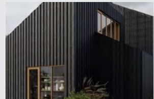
Biobaserede byggerier som Tversted House