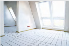
Renoveringer af over- tager i parcelhuse