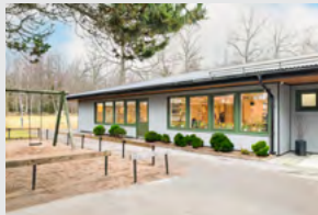
Steder med behov for hurtig gulvvarme